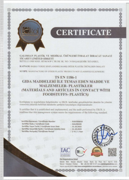
TS EN 1186-1