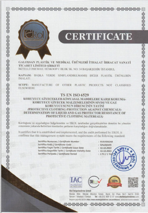
TS EN ISO 6529